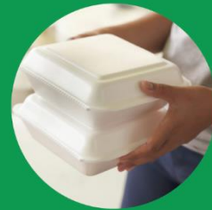
περιέκτες τροφίμων από φελιζόλ