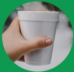
κυπελάκια ποτών από φελιζόλ