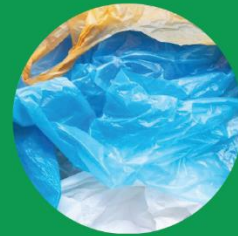
πάσης φύσεως προϊόντα που διασπώνται σε μικροπλαστικά (οξοδιασπώμενα)

Απαγόρευση της διάθεσης στην αγορά 10 προϊόντων από τον Ιούλιο του 2021