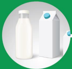
Φιάλες και περιέκτες ποτών