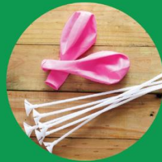
στηρίγματα για μπαλόνια