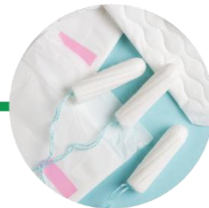
είδη προσωπικής υγιεινής