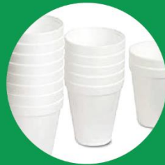
περιέκτες ποτών από φελιζόλ