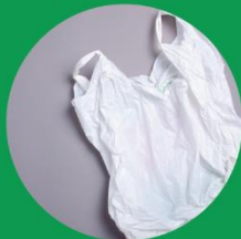
λεπτές σακούλες μεταφοράς